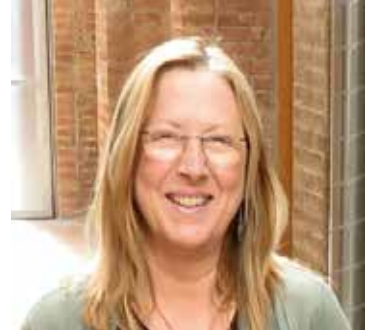
Dolors Castellà Puig Alcaldeessa de la Garriga