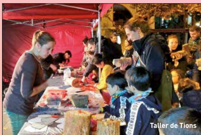
Taller de Tions