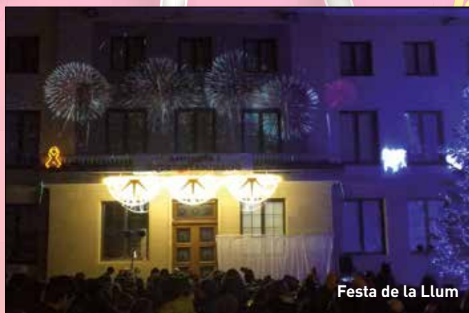
Festa de la Llum