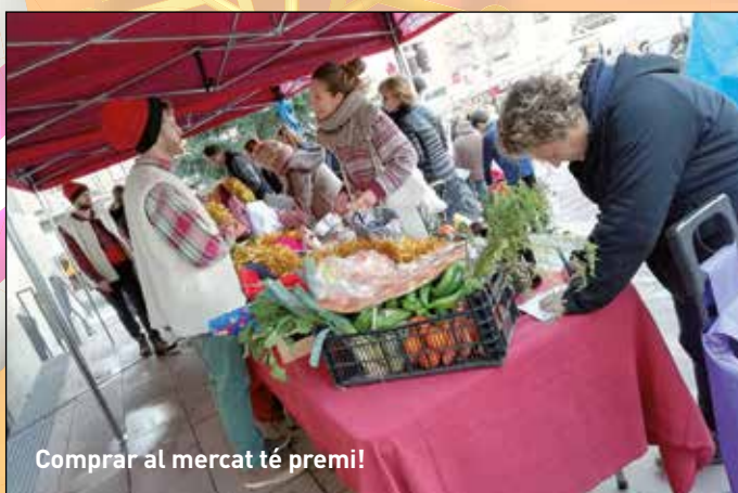
Comprar al mercat té premi!