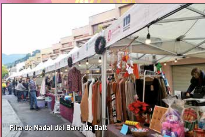
Fira de Nadal del Barri de Dalt