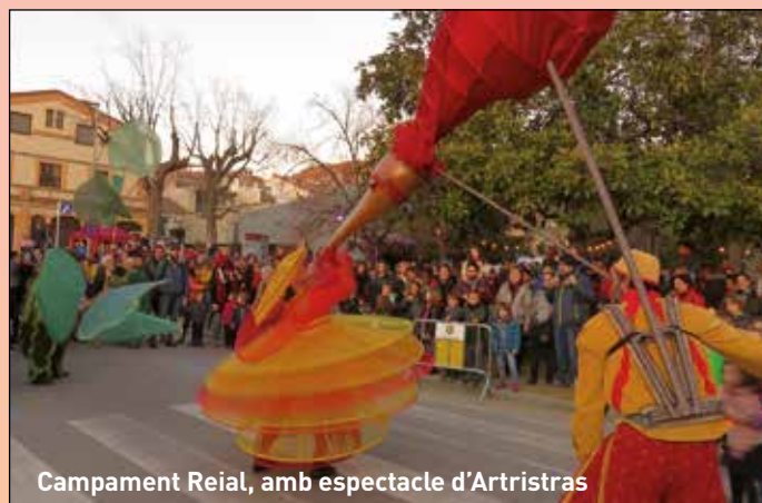
Campament Reial, amb espectacle d'Artristras