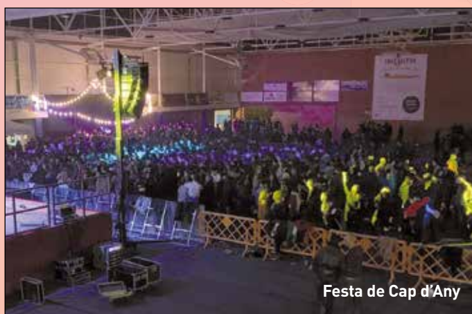
Festa de Cap d'Any