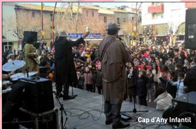
Cap d'Any Infantil