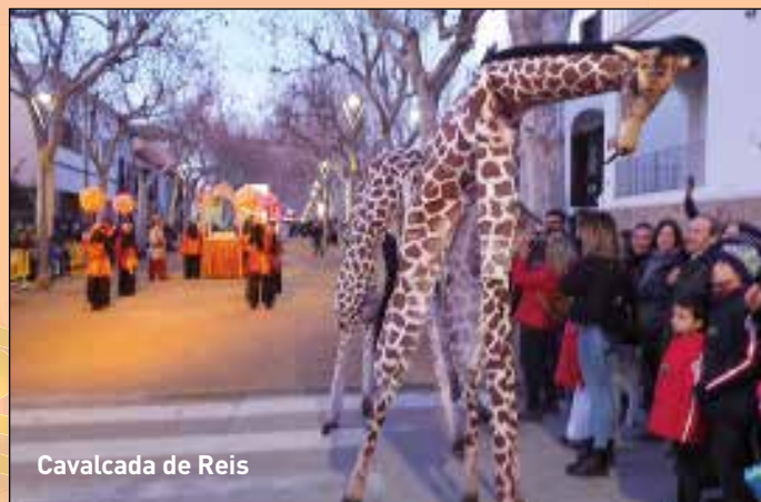
Cavalcada de Reis