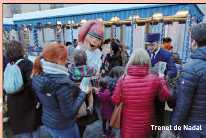
Trenet de Nadal