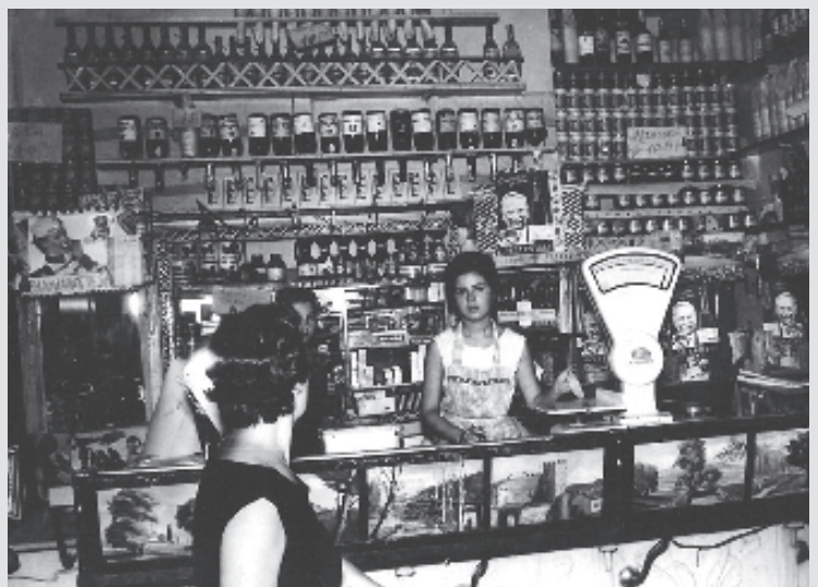
La botiga de cal Matador, al carrer Banyes 86, a finals dels anys 60.

Les places són limitades i les inscripcions es poden fer a info@visitalagarriga.cat o al 610 47 78 23.