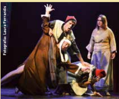
Fotografia: Laura Ferrandis

L'associació Fem Pastorets torna a presentar la seva adaptació particular –i trencadora– d'aquesta obra tradicional. Els Pastorets es podran veure al Teatre de la Garriga–El Patronat els dies 25, 26, 29 de desembre i 11 de gener. Més informació i entrades a www.teatrelagarriga.cat .