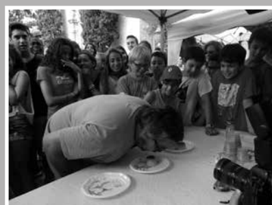
El concurs de flams