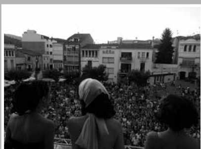
El pregó, amb les Divines

Sec. El Passeig va ser, cada nit, l'escenari de concerts. També hi va haver música, de dia i de nit, a la plaça del Silenci, on el swing es va convertir en el gran protagonista i va reunir una munió d'aficionats. Les activitats infantils, esportives, teatrals i lúdiques van completar un programa de Festa Major amb propostes per a tots els gustos.