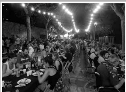
El sopar de Festa Major, al Passeig