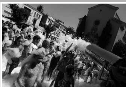
La Festa de l'Escuma, un clàssic