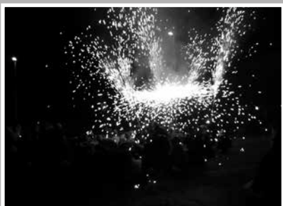
Correfoc amb el Front Diabòlic