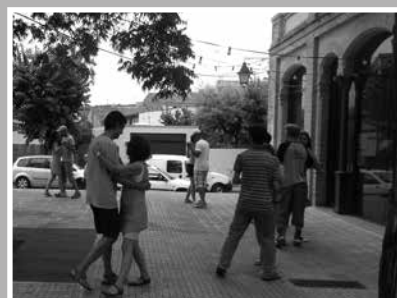
Swing a la plaça del Silenci