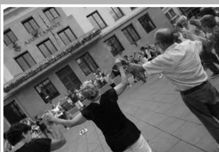
Sardanes, a la plaça