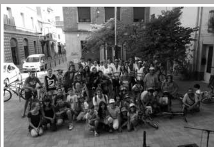
Participants a la Gimcana Secreta