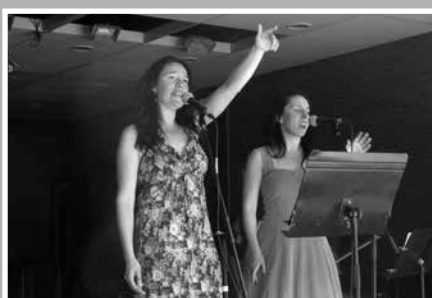
Concerts Vermut a l'Auditori