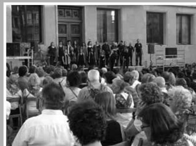
Multitudinari concert de gòspel