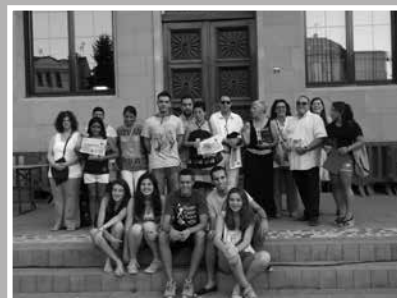
Premis dels concursos de Festa Major