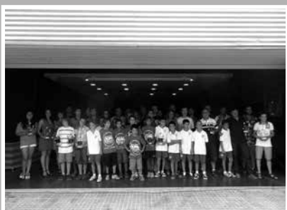
Homenatge als esportistes