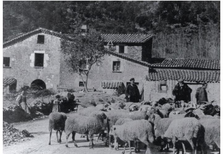
El veïnat de Gallicant a principis del segle XX

El proper 27 de març es presentarà a la ciutadania el llibre Història de la Garriga. Dels primers assentaments humans al segle XXI , una publicació que, per la seva magnitud i les seves característiques, està destinada a convertir-se en l'obra de referència per a l'estudi i el coneixement de la història del municipi. L'acte tindrà lloc a les 20 hores a la Biblioteca Núria Albó.