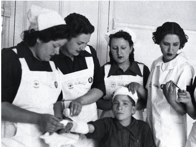
Imatge de l'Auxilio Social franquista de la Garriga

Quatre especialistes han revisat i actualitzat el passat del municipi