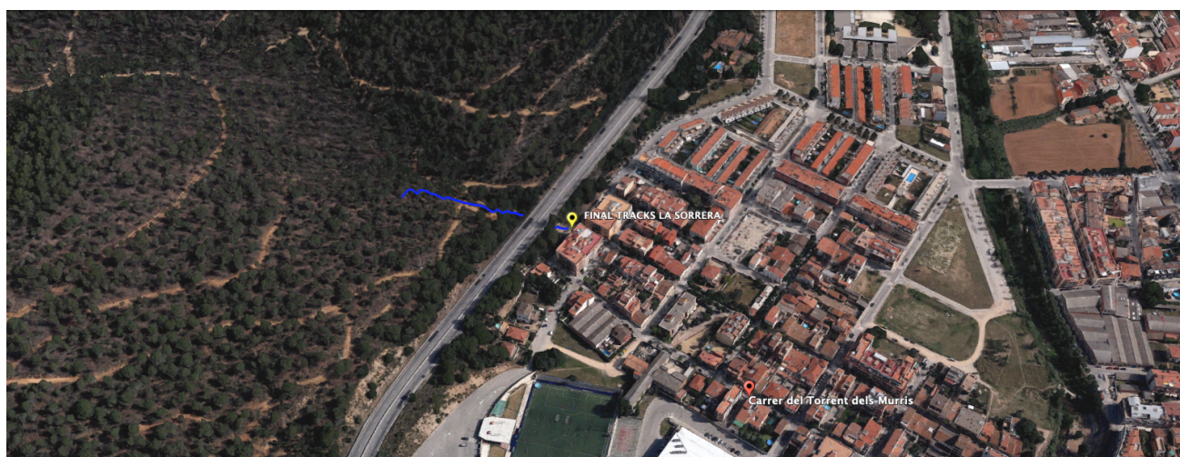
Plànol Torrent del Murris - Final dels tracks de La Sorrera