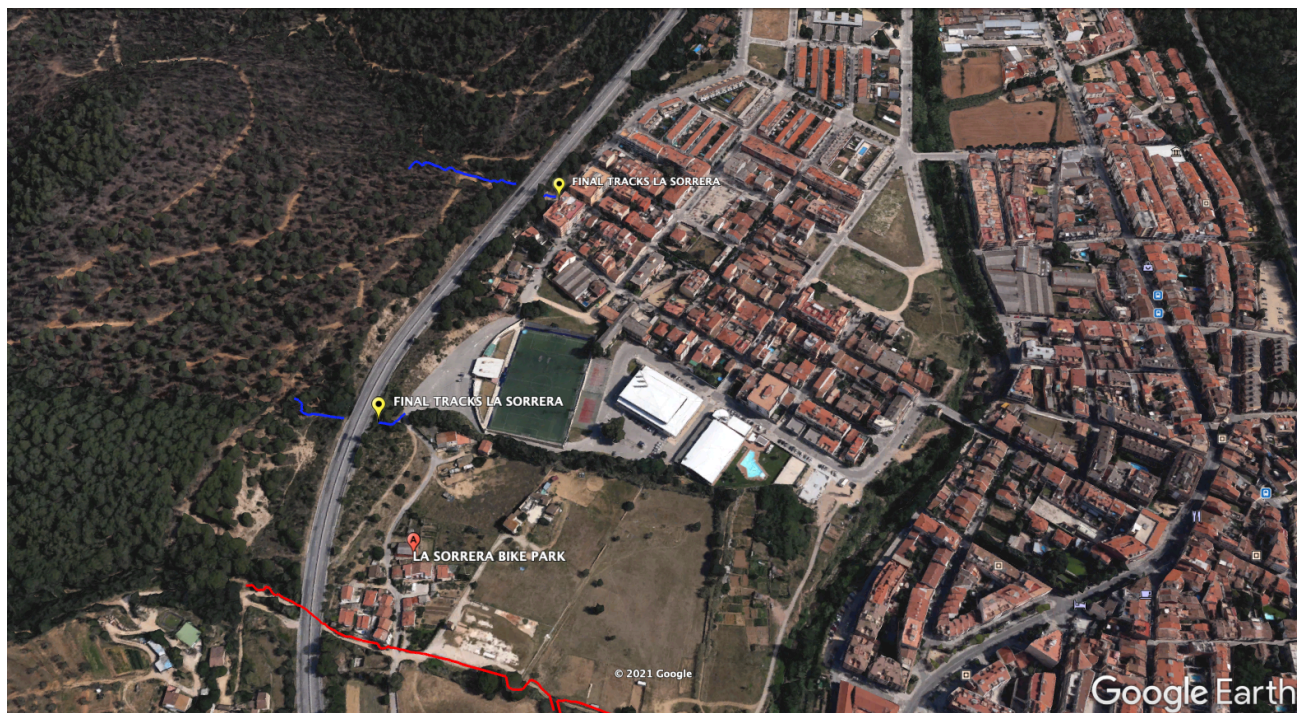
Plànol general del final dels tracks de La Sorrera (Blau) vs Torrent de Can Boget (vermell) no Sorrera.