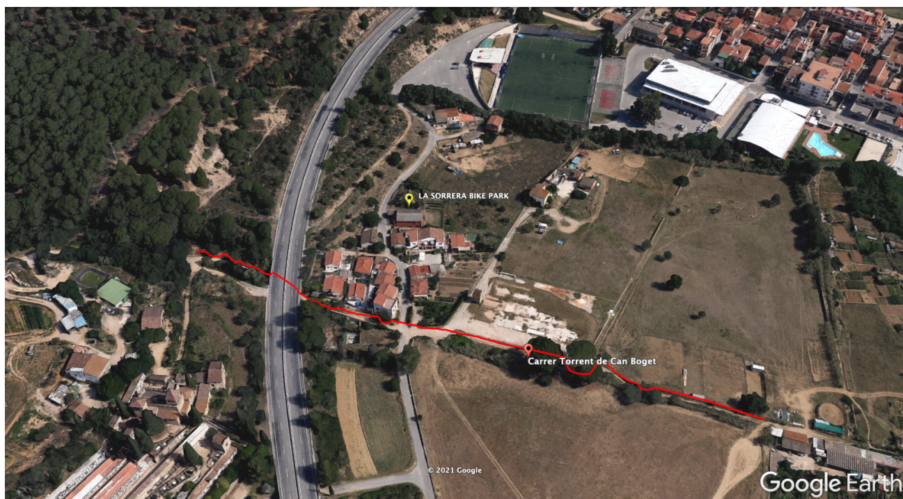
Plànol Torrent de Can Boget (Can Pona) - No recinte La Sorrera