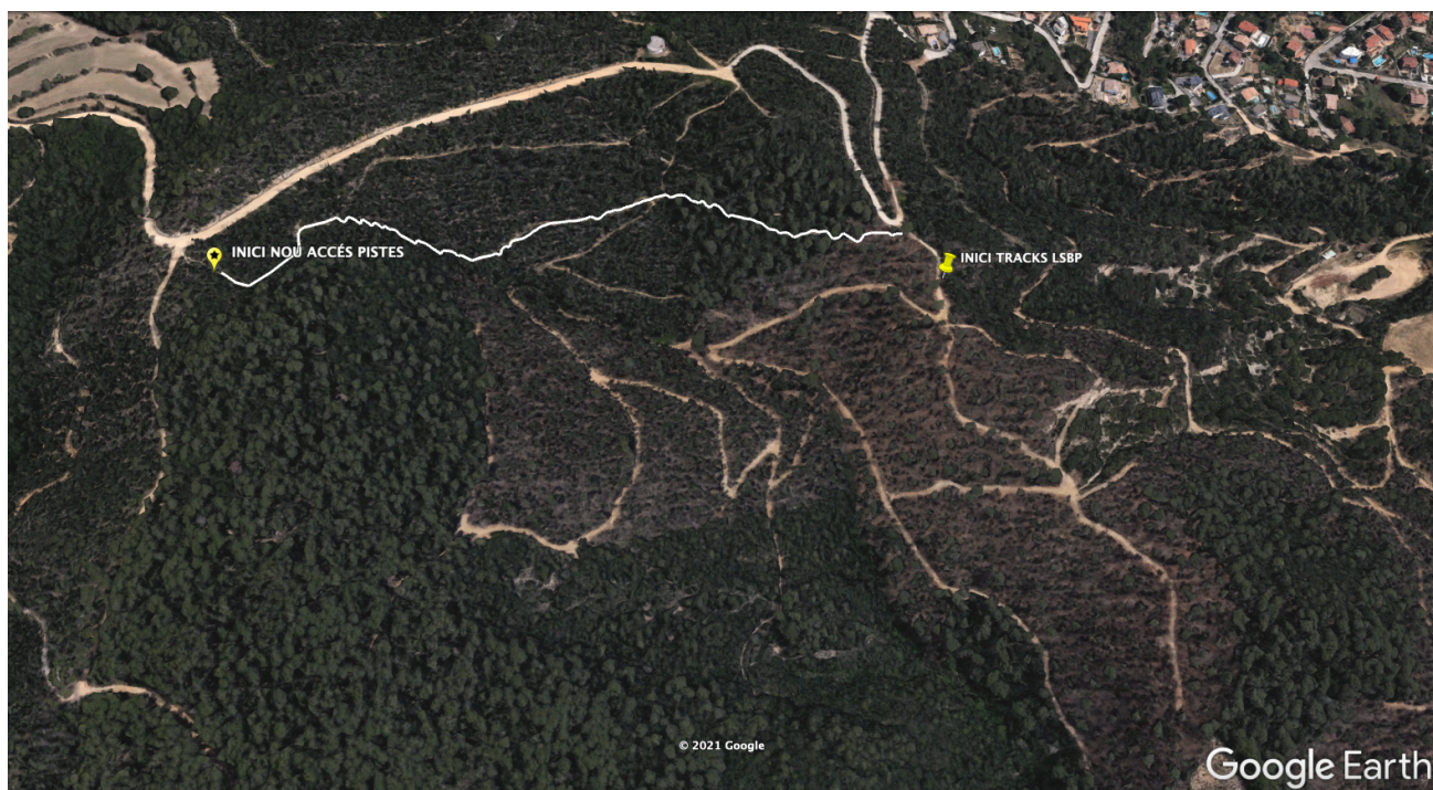
Imatge Google Earth de la pista de deforestació usada. Nous accés.