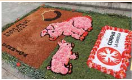
Fira de Corpus