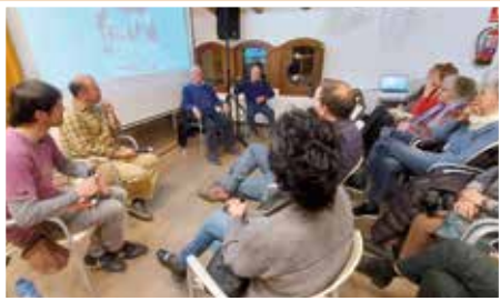
Xerrada sobre el maneig del porc