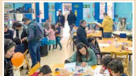
Tallers petit EMAD