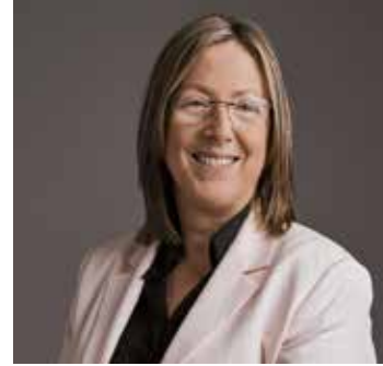
Dolors Castellà Puig Alcaldeessa de la Garriga