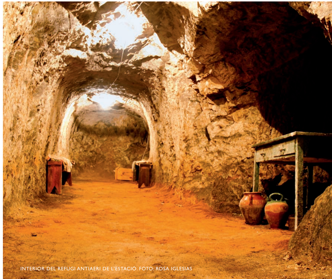
INTERIOR DEL REFUGI ANTIAERI DE L'ESTACIÓ.