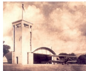
L'HANGAR DEL CAMP D'AVIACIÓ DE ROSANES.