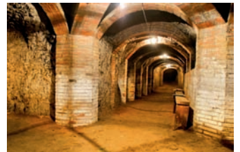
INTERIOR REFUGI.

El juliol del 2006, el refugi antiaeri de l'estació de la Garriga es va convertir en el primer element d'aquest tipus museïtzat a Catalunya . Des de llavors, a través de les visites guiades que s'hi realitzen regularment, s'ha convertit en un element de referència del Patrimoni garriguenc i en un nou pol d'atracció de visitants. Per tal de millorar l'oferta del refugi i afegir-hi noves fonts d'informació i elements d'interpretació, s'ha creat un audiovisual , que enriqueix encara més les visites que s'hi realitzin.